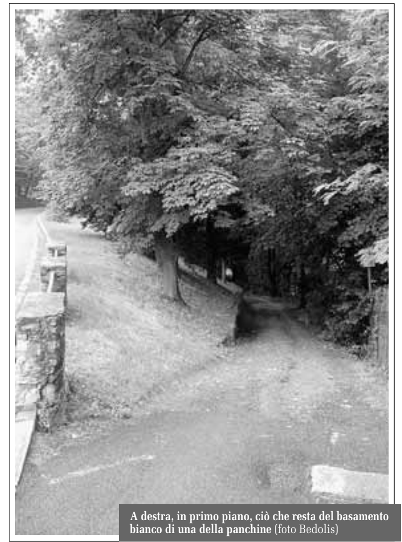
A destra, in primo piano, ciò che resta del basamento bianco di una delle panchine